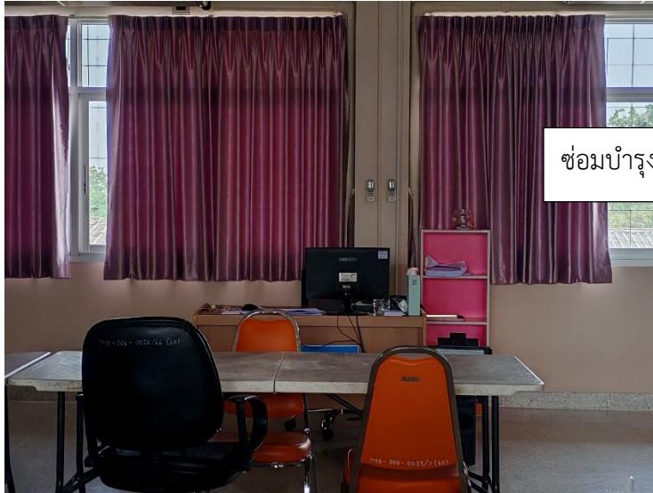
ซ่อมบำรุงเครื่องมือแพทย์